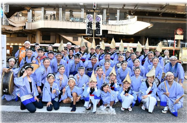
～三鷹市長賞を受賞した「三鷹花道連」～