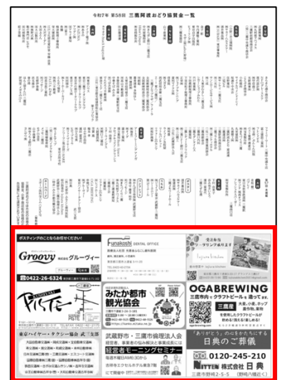
▲パンフレット（白黒）枠