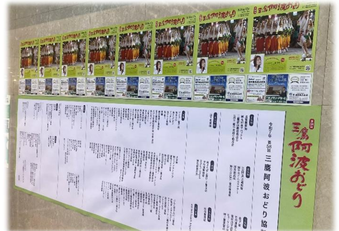
～三鷹コラル 協賛企業一覧揭示の様子～