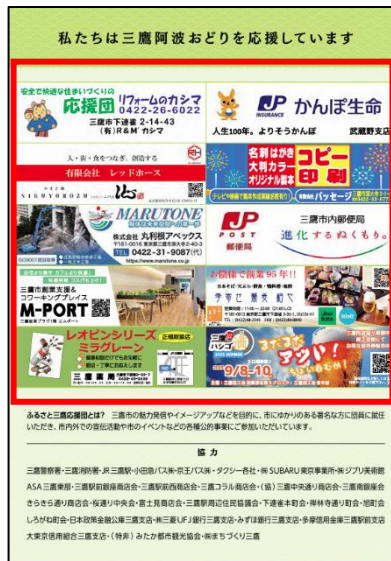
▲パンフレット（カラー）枠